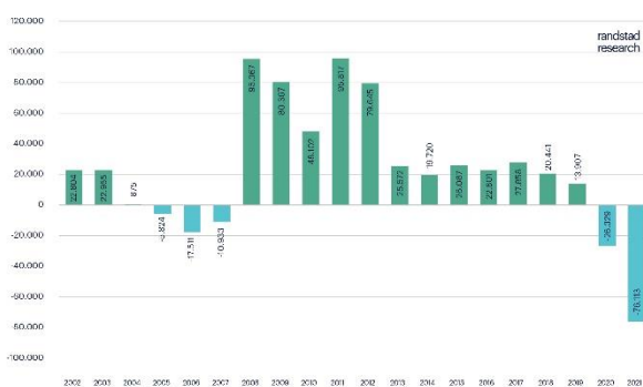
Meses de septiembre desde 2002